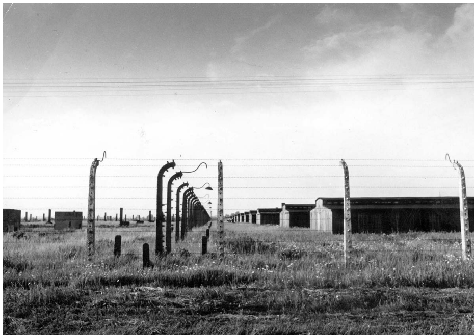
Bild på koncentrations- och förintelselägret Auschwitz-Birkenau. Människorna i förintelseläger arbetade mycket hårt. Många mördades eller dog av svält och sjukdomar.

Det lägret låg i det ockuperade landet Polen.