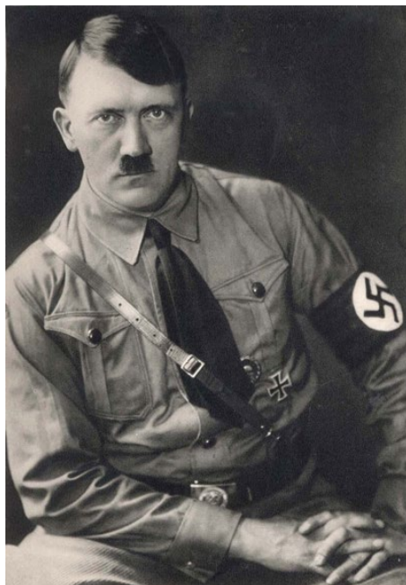
Bild på Adolf Hitler, nazisternas ledare. På ärmen syns ett hakkors som nazisterna använde som sin symbol.