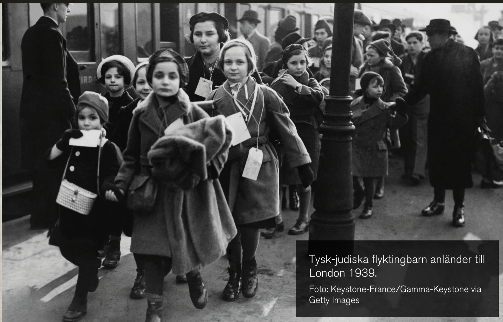
Tysk-judiska flyktingbarn anländer till London 1939.

Brev från ett judiskt barn till Judiska församlingen i Stockholm 1939