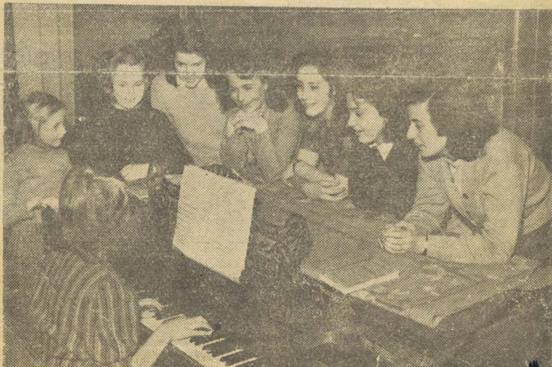
Sångstund vid pianot

Flyktingbarn som vuxit upp och försvenskats