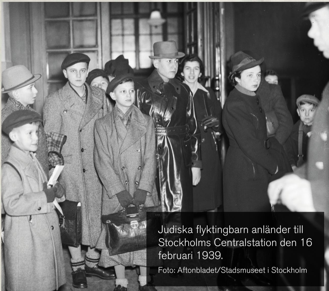
Judiska flyktingbarn anländer till Stockholms Centralstation den 16 februari 1939.

Andra barn placerades i olika slags gruppboenden, som barnhem, skolhem eller andra former av kollektiva boenden. Det upprättades minst sju olika kollektivhem för judiska flyktingbarn i Sverige.